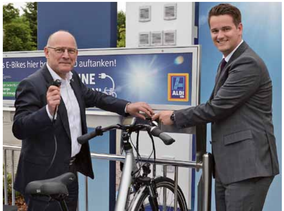
[-] Für den sauberen Zweiradverkehr hat der bekennende Radler Winfried Hermann besonders viel übrig.

Winfried Hermann: Das sehe ich nicht so, es gibt viele ermutigende Ansätze, wenn Sie sich international umsehen. Die alte Stadtplanung hat sich ausschließlich am Auto orientiert. Dann hat man begonnen, Fußgängerzonen einzurichten, weil die Menschen immer weniger Platz hatten. Dadurch wurden die Verkehre komplett getrennt, es gibt aber keine richtige Verbindung zwischen den Zonen. Die Menschen fahren ins Parkhaus, gehen in die Fußgängerzone und fahren anschließend wieder nach Hause. Eine moderne Mobilitätspolitik will die Aufenthaltsqualität in der gesamten Stadt verbessern. Ich wohne beispielsweise im Stuttgarter Heusteigviertel in einer Straße, in der kein Baum steht und die zum langgestreckten Parkplatz verkommen ist. Die Parallelstraße hat Bäume und begrünte Ecken, Cafés mit Tischen und Stühlen auf dem Gehweg und vielem mehr. In der einen Straße treffen sich die Leute und es geht lebendig zu, in der anderen ist gar nichts. Es gibt viele Viertel, die zwar verkehrsberuhigt sind, aber als Großparkplatz missbraucht werden. Da müssen wir ansetzen, und das ist auch nicht teuer. Man muss nicht die gesamte Straße umbauen, um urbane Lebensqualität zu ermöglichen. Die Verbesserungen im Kleinen bringen oft mehr und kosten weniger. [-]