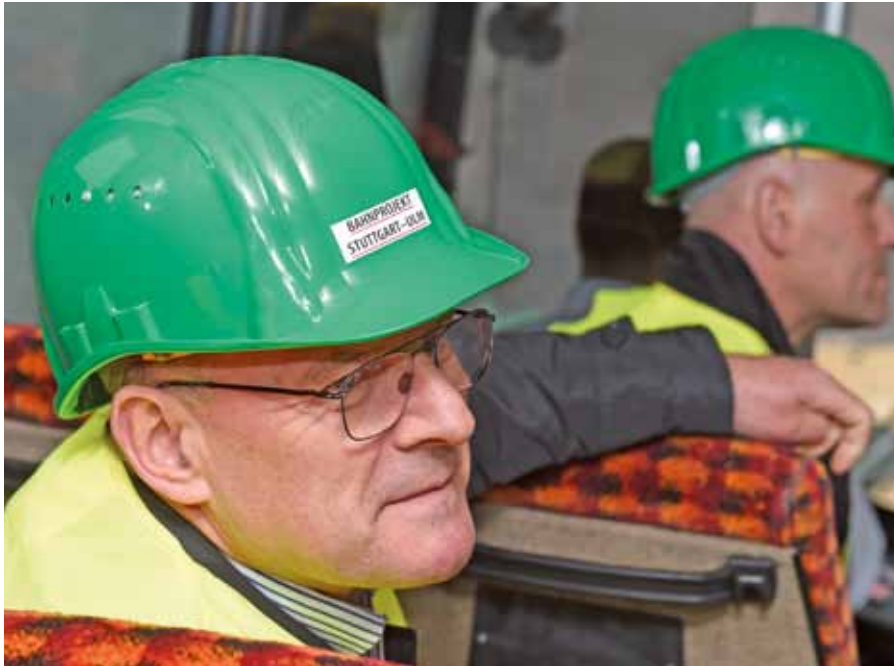
☒ „Es gilt, über Stuttgart 21 hinaus zu denken“, sagt der mitunter auch polarisierende Grünen-Politiker.

weitere Reduzierungsmöglichkeiten gibt, etwa über die Nummernschilder. Wie auch immer, eines steht fest: Wenn wir nicht handeln, wird uns das teuer zu stehen kommen. Die Europäische Kommission kann Bußgelder in sechsstelliger Höhe verhängen – pro Tag.