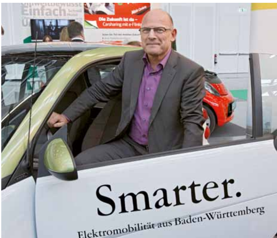
Der Verkehrspolitiker Hermann wirbt gerne und oft für eine moderne, ganzheitliche Mobilitätspolitik ...

Winfried Hermann: Ich stehe und werbe für eine moderne, ganzheitliche Mobilitätspolitik, die alle Verkehrsträger auf einfache Weise und benutzerfreundlich miteinander vernetzt. Die